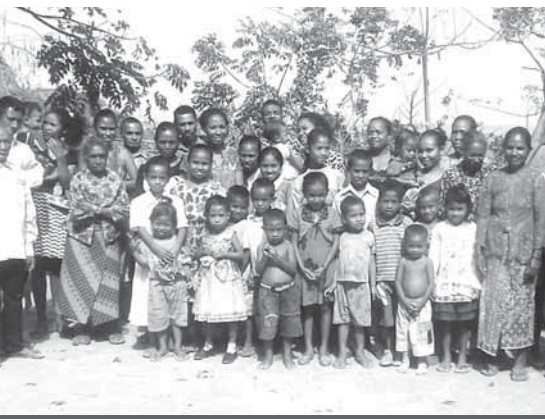
Ol Kristen long Borai Sande Lotu

“Bikpela, skulim mipela long daunim mipela yet, givim mipela hangre long save long yu, laikim yu na givim biknem long yu wantaim olgeta tingting na pasin bilong mipela.” God i kisim biknem! Ol i gat hangre na bel bilong ol i op tru long harim na lainim. Maski, em i longpela hap, ol i save taitim bun long kam long Sande lotu.