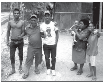
Visitim ol sumatin long ples Dare

Visit long ples Dare long bungim ol sumatin bilong bipo. Nau ol i bikpela manmeri na mipela i save strongim ol long Tok bilong God. Ol i tingim yet 1 Jon 1.7, Jon 3.16, Jon 14.6. Tok i stap pinis long bel bilong ol.