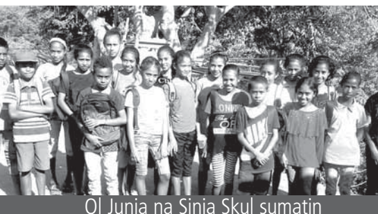
Ol Junia na Sinia Skul sumatin

“Bikpela, skulim mipela long daunim mipela yet, givim mipela hangre long save long yu, laikim yu na givim biknem long yu wantaim olgeta tingting na pasin bilong mipela.” God i kisim biknem! Ol i gat hangre na bel bilong ol i op tru long harim na lainim. Maski, em i longpela hap, ol i save taitim bun long kam long Sande lotu.